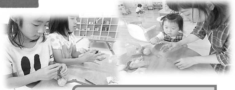
てるてるぼうずづくり