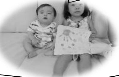
オリジナルハンカチづくり