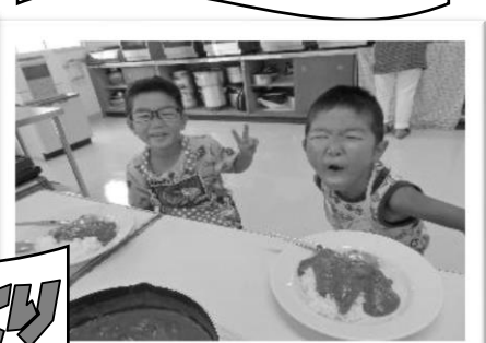
なつやすみカレーづくり