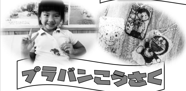
プラパンことうさく