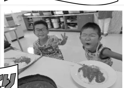
なつやすみカレーづくり