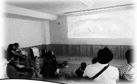
なつやすみシアター