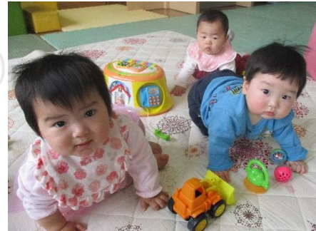
いろいろな音がでて楽しいね