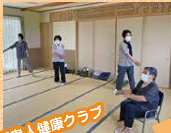
住江老人健康クラブ