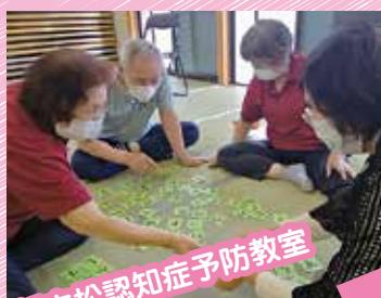
新吉松認知症予防教室