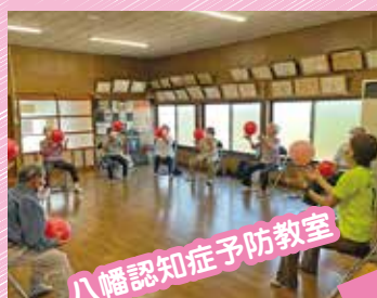
八幡認知症予防教室