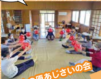
上の原あじさいの会