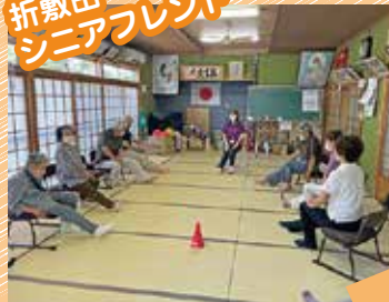
折敷田 シニアフレンド