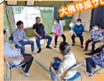
大佛体操サロン会