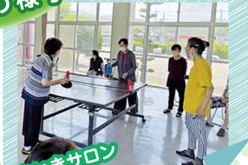
月の瀬いきいきサロン