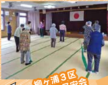
柳ヶ浦3区 自治区子安会