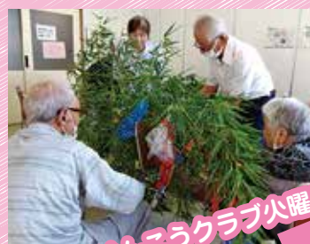
安心院けんこうクラブ火曜日

元気なうちから「自主的に取り組む」「継続的に行う」「参加者自身が考え運営する」ことが認知症予防に効果的です！