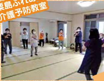
粟島ふれあい 介護予防教室