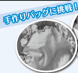
手作りバッグに挑戦！