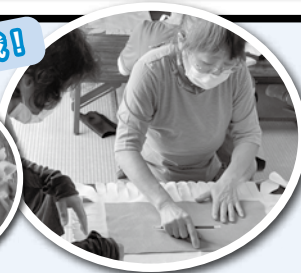
レク用品って楽しい！