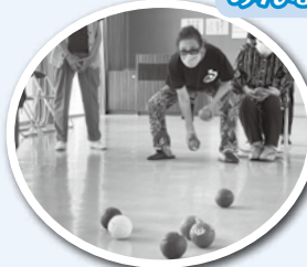
今も現役で動けるぞ！