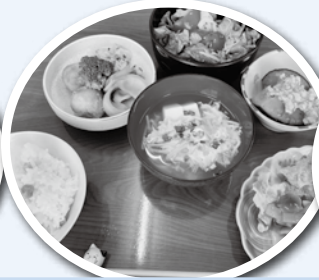
みんなで食べるご飯は特別おいしいね！