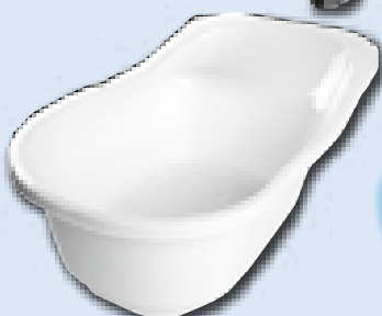
○ベビーバス○ 沐浴用