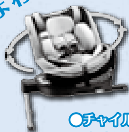
○チャイルドシート○ 新生児～4歳頃